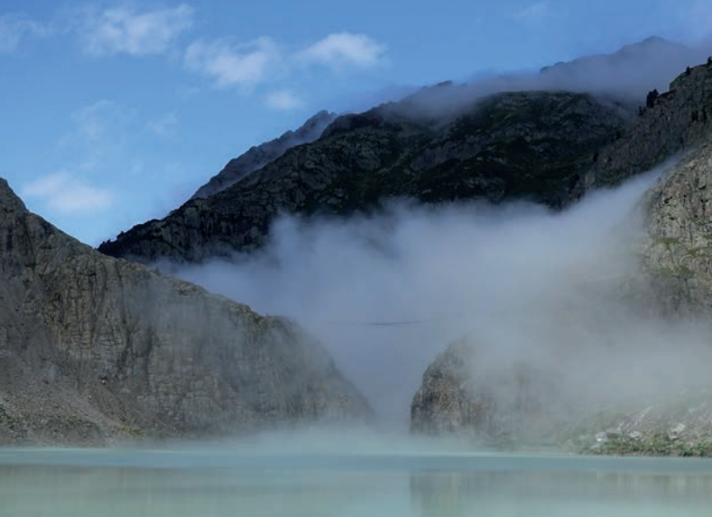
Der natürliche Triftsee mit der berühmten Hängebrücke. Die Staumauer würde die Brücke um rund 30 m überragen.